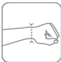
Měřeno přes zápěstí