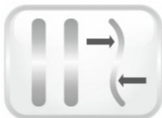
Kovové tvarovatelné výztuhy