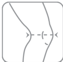
Měří se přes koleno