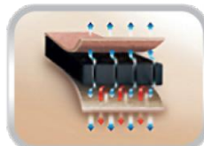
Aeroprén (zdravotně nezávadný neoprén s mikroventilací)